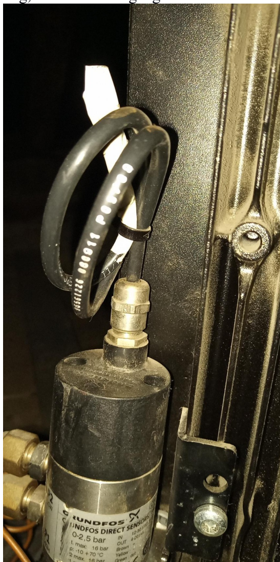
Kikötött szivattyú nyomás érzékelő!

Helyszíni állapotfelmérés során a hűtést biztosító hűtőgépet és a csőrendszert is ellenőriztük a padlás térben. Minden lakáshoz kiépített leállásnál a fő csővezetékről szabályzó csap van beépítve, ezek 100% ra vannak nyitva. Tervezésnél minden leágazást úgy építettek ki, hogy az szabályozható legyen, és a lakásoknál is még is lehetőség van a precíz beállításra. Ezek beállítása nem történt meg, valószínűleg szükségtelen volt. Folyadék áramoltatását szivattyú biztosítja, ami alkalmas lenne az üzemi nyomás igény szerinti szabályzásra. Jelenleg 100% a teljesítménye, nincs bekötve a nyomás érzékelése. Bekötése inverteres meghajtást tesz lehetővé, amivel az üzemi nyomás beállítható üzemi értékre . Pontos típusa nem látható a szivattyúnak, de 8-16 Bar között lehet az üzemi nyomása jelenleg, ami több a megengedettnél.